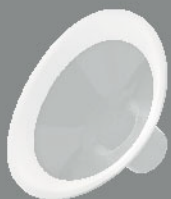
PersonalFit Flex™ 舒悅版吸奶喇叭 24 mm x 1個