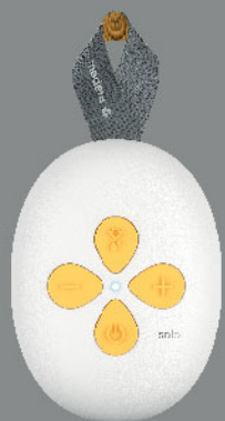
Solo™ 主機 x 1