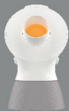
PersonalFit Flex™ 舒悅版接駁器 x 1個