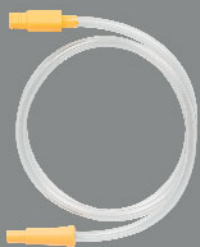
喉管 x 1條